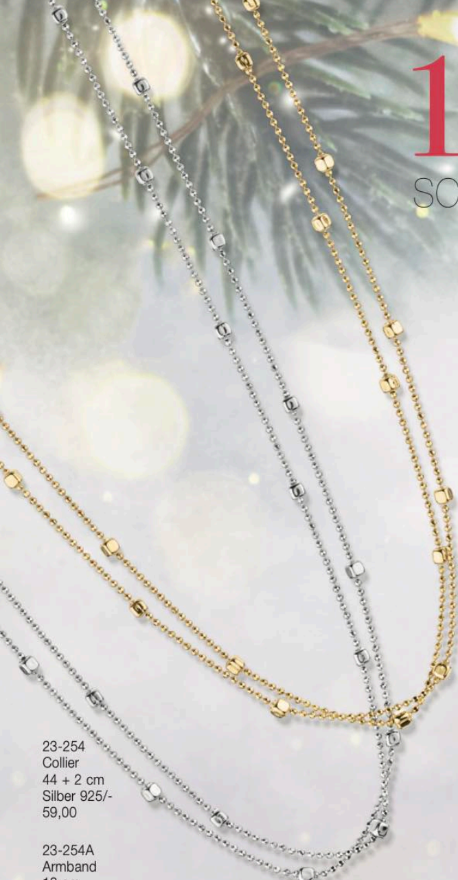
23-254 Collier 44 + 2 cm Silber 925/- 59,00