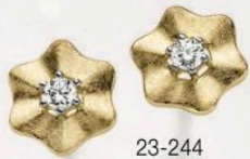
23-244 Ohrstecker Zirkonia* Gold 333/- 229,00