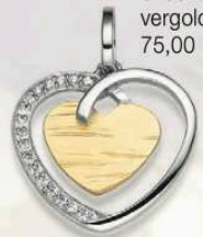
23-227 Anhänger Zirkonia* Silber 925/ vergoldet 75,00