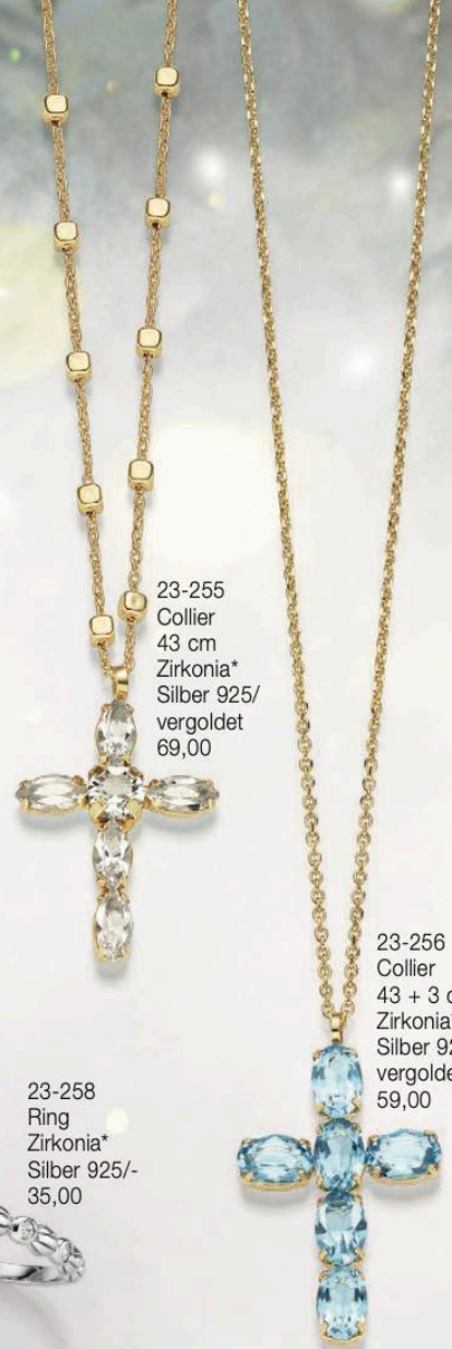
23-255 Collier 43 cm Zirkonia* Silber 925/ vergoldet 69,00