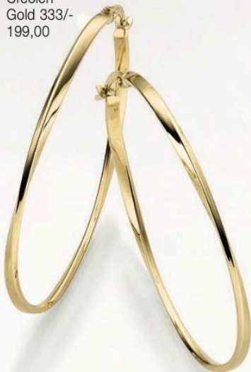
23-241 Creolen Gold 333/- 199,00