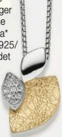
23-219 Anhänger o. Kette Zirkonia* Silber 925/ vergoldet 79,00