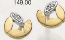
23-211 Ohrstecker Zirkonia* Gold 333/- 149,00