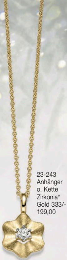
23-243 Anhänger o. Kette Zirkonia* Gold 333/- 199,00