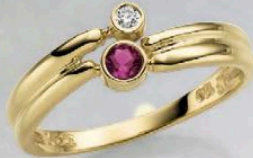
23-233 Ring Zirkonia*/Rubin Gold 333/- 299,00