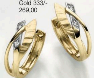
23-252 Creolen Zirkonia* Gold 333/- 269,00