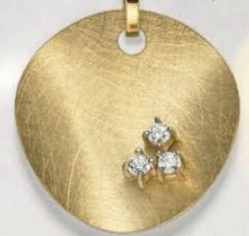
23-247 Anhänger o. Kette Zirkonia* Gold 333/- 199,00