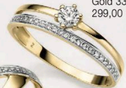
23-237 Ring Zirkonia* Gold 333/- 299,00