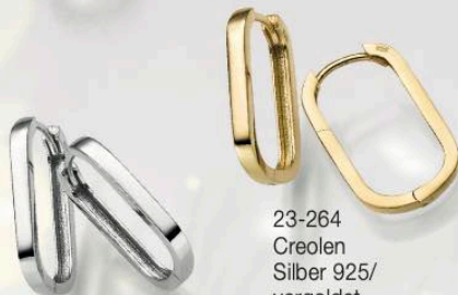
23-263 Creolen Silber 925/- 49,00