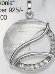
23-230 Anhänger Zirkonia* Silber 925/- 79,00