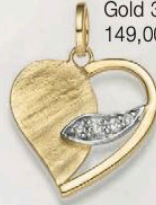
23-246 Anhänger Zirkonia* Gold 333/- 149,00