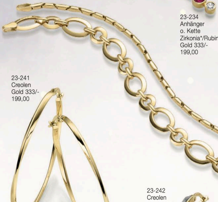
23-241 Creolen Gold 333/- 199,00