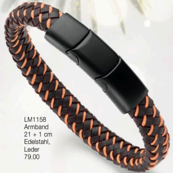
LM1158 Armband 21 + 1 cm Edelstahl, Leder 79,00