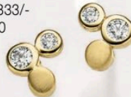
23-210 Ohrstecker Zirkonia* Gold 333/- 139,00