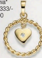
23-208 Anhängen Zirkonia* Gold 333/- 119,00