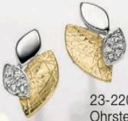
23-220 Ohrstecker Zirkonia* Silber 925/ vergoldet 69,00