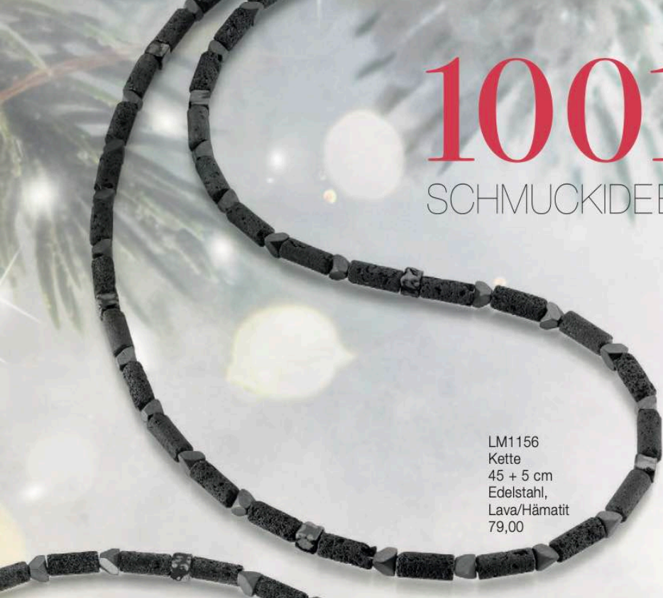
LM1156 Kette 45 + 5 cm Edelstahl, Lava/Hämatit 79,00