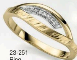
23-251 Ring Zirkonia* Gold 333/- 259,00