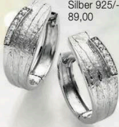
23-217 Creolen Zirkonia* Silber 925/- 89,00