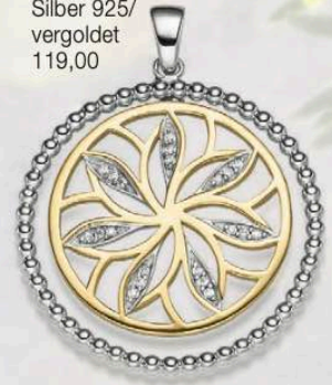
23-229 Anhänger Zirkonia* Silber 925/ vergoldet 119,00