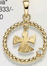
23-207 Anhängen Zirkonia* Gold 333/- 139,00