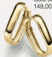
23-215 Creolen Gold 333/- 149,00