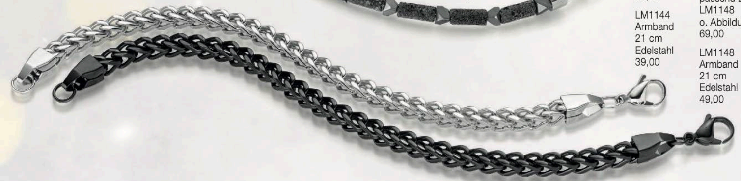
LM1148 Armband 21 cm Edelstahl 49,00