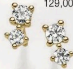
23-206 Ohrstecker Zirkonia* Gold 333/- 129,00