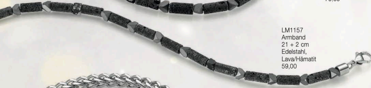
LM1157 Armband 21 + 2 cm Edelstahl, Lava/Hämatit 59,00