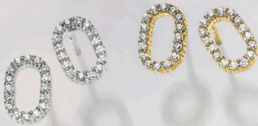
23-259 Ohrstecker Zirkonia* Silber 925/- 49,00