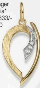
23-250 Anhänger Zirkonia* Gold 333/- 169,00