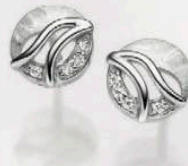
23-231 Ohrstecker Zirkonia* Silber 925/- 59,00