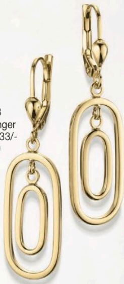
23-213 Ohrhänger Gold 333/- 219,00