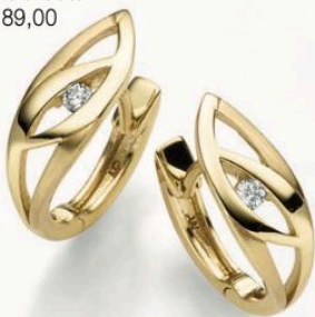
23-249 Creolen Zirkonia* Gold 333/- 289,00