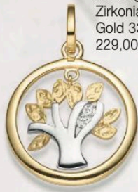
23-245 Anhänger Zirkonia* Gold 333/- 229,00