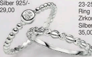
23-258 Ring Zirkonia* Silber 925/- 35,00