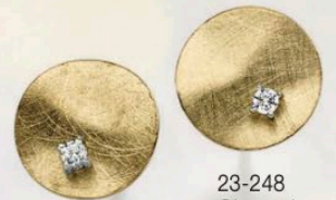
23-248 Ohrstecker Zirkonia* Gold 333/- 229,00