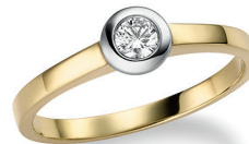
BRI 15. 0,15 ct.