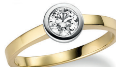
BRI 15. 0,50 ct.