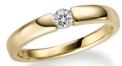
BRI06. 0,15 ct.