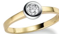
BRI 15. 0,25 ct.