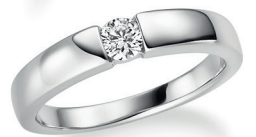
BRI07. 0,20 ct.